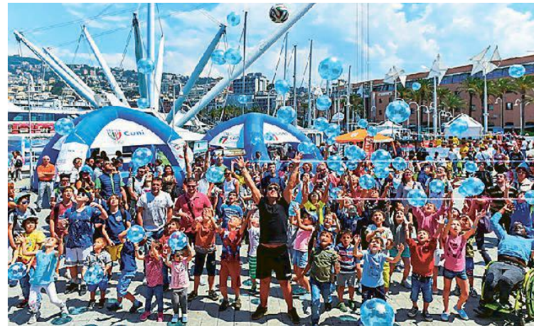
Il "flash mob" del palleggio di Stelle dello Sport dello scorso anno

nell'area ginnastica della Festa (ore 17,30) mentre lì vicino tra le moto sfreccerà Niccolò Canepa che sfiderà i giovani centauri liguri (ore 16,30). Già all'inaugurazione del 24 mattina (ore 9,30) i giovani delle scuole potranno incontrare l'oro paralimpico di nuoto Francesco Bocciardo e il numero uno del Cip Luca Pancalli, protagonisti di una speciale Giornata Paralimpica. Poi tutti all'Olimpiade delle Scuole con l'esibizione di Paolo Rossi, freestyler genovese in Piazza delle Feste (ore 12). A premiare i vincitori del