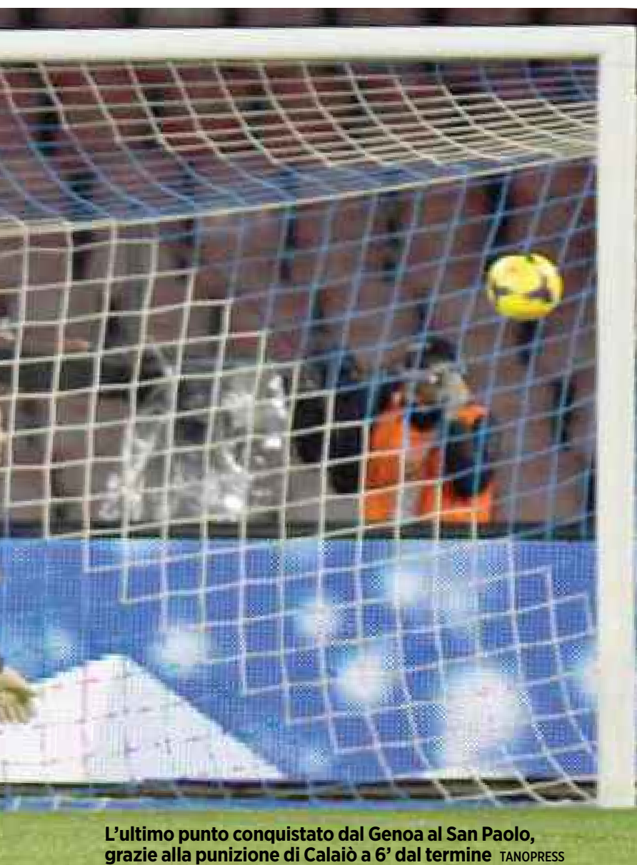
L'ultimo punto conquistato dal Genoa al San Paolo, grazie alla punizione di Calaiò a 6' dal termine