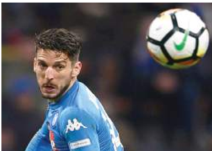
Dries Mertens è nato a Lovanio (Belgio) il 6 maggio 1987

BOMBER tascabile, cuore gigante. Dries Mertens è il falso nove più forte della A. Alto appena un metro e 69, una piccola grande macchina da gol. Ma definirlo solo così è riduttivo. Perché Mertens è molto di più, è un ragazzo che annulla stereotipi e luoghi comuni, in campo e fuori. Un belga napoletano entrato nel cuore della città come solo i grandi campioni sudamericani, in passato, erano riusciti a fare.