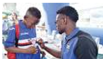
Duvan Zapata firma autografi