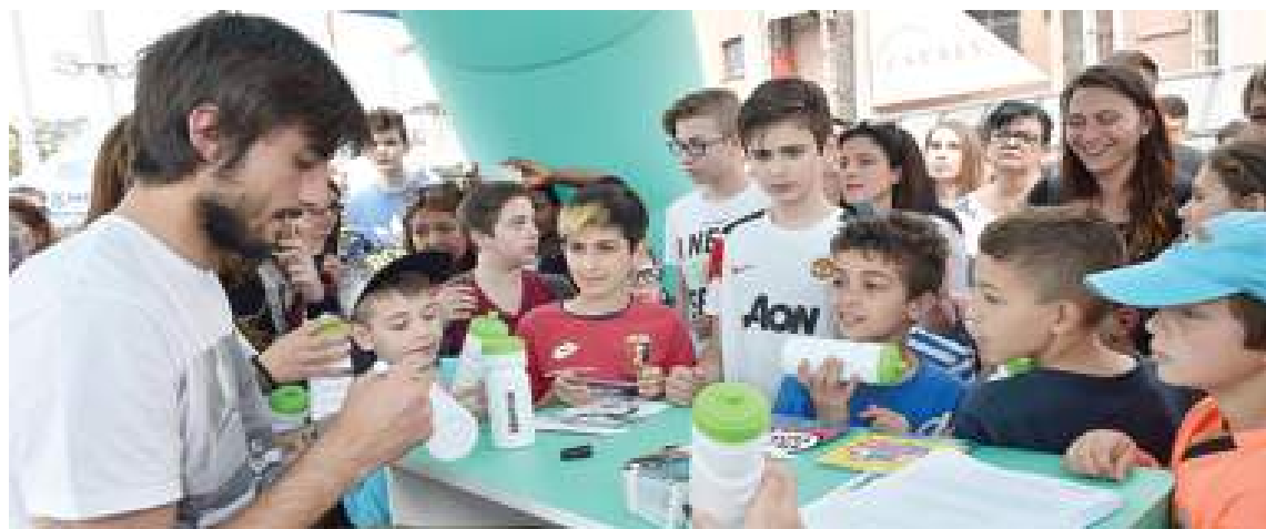
Mattia Perin alla Festa dello Sport in mezzo a grandi e bambini

Lunga giornata di sport, col Porto Antico trasformato in palestra a cielo aperto. Dove c'è chi balla il tango, chi prova il canottaggio e chi si diverte con i palleggi freestyle. Poi arrivano gli eroi della domenica. Per la